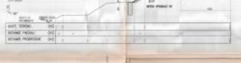
SEZIONE D IN 1000'