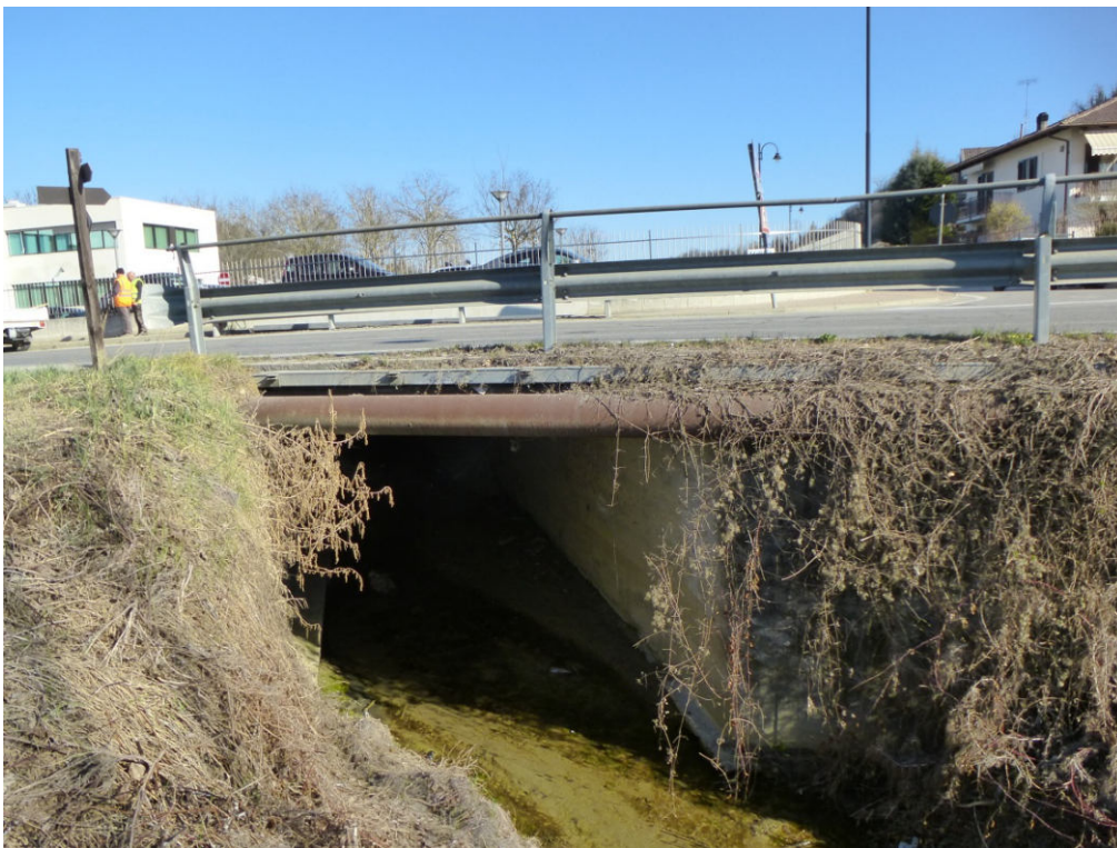
Figura 8 - ponticello su Rio Gavel vista da monte.