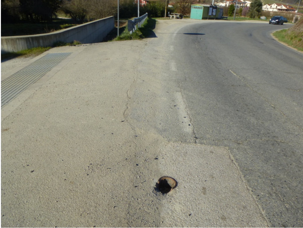
Figura 3 - direzione rotonda posizione rete gas bordo strada rete distribuzione metano

Comune di Vezza d'Alba, Località Bobore; spostamento adduttrice per Govone e rivisitazione sistema adduzione comuni di Govone, Castellinaldo, Castagnito Priocca e Magliano Alfieri.