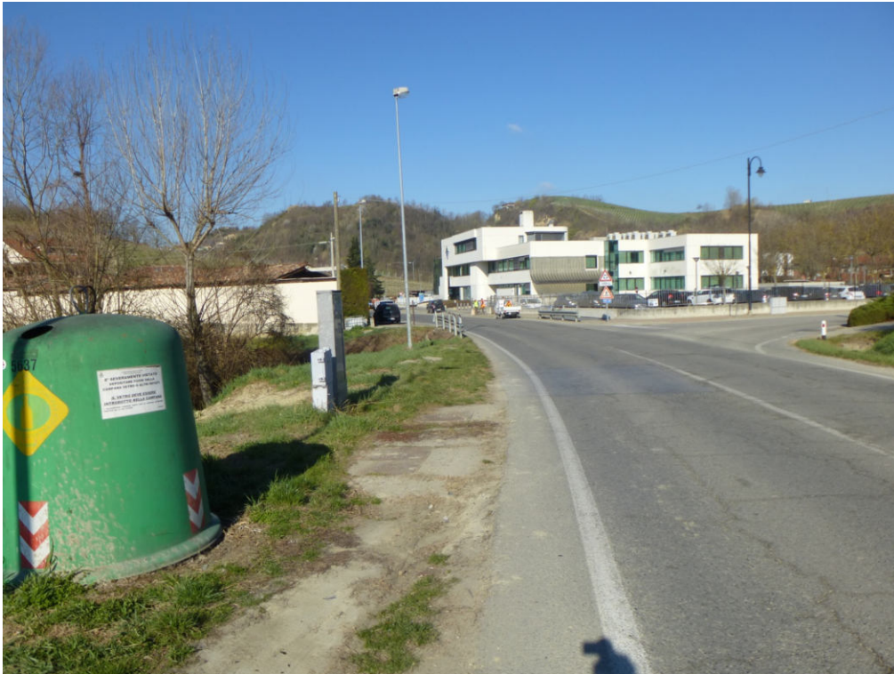
Figura 7 - direzione rotonda. Ponticello Rio Gavel. A sinistra centralina telefonica, a destra incrocio con Via Castellero

Comune di Vezza d'Alba, Località Bobore; spostamento adduttrice per Govone e rivisitazione sistema adduzione comuni di Govone, Castellinaldo, Castagnito Priocca e Magliano Alfieri.