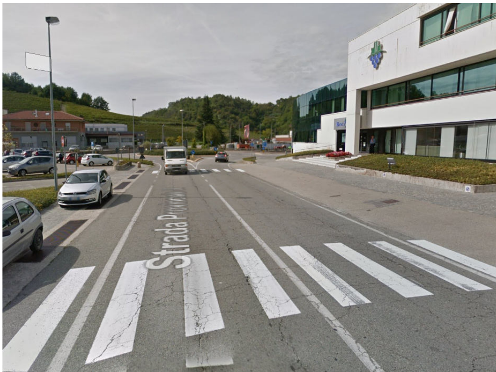
Figura 10 - punto finale di sostituzione condotta e riallaccio alla rete esistente