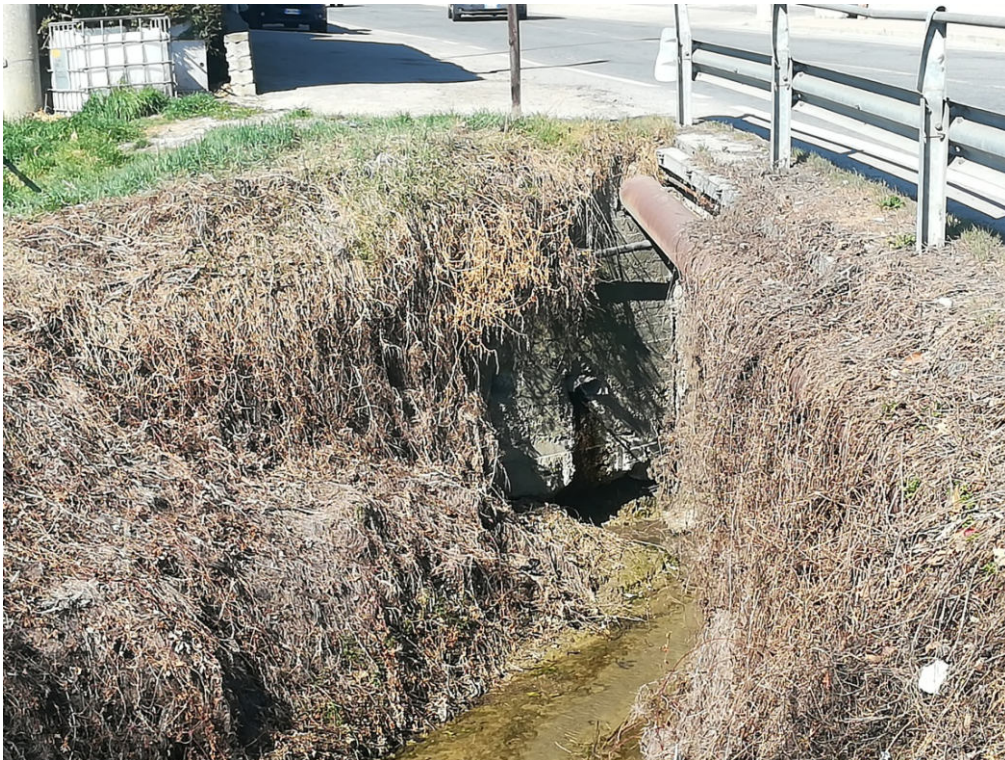
Figura 9 - opera di sostegno strada di accesso fondi agricoli, punto di realizzazione dell'attraversamento in sub-alveo.

Comune di Vezza d'Alba, Località Bobore; spostamento adduttrice per Govone e rivisitazione sistema adduzione comuni di Govone, Castellinaldo, Castagnito Priocca e Magliano Alfieri.