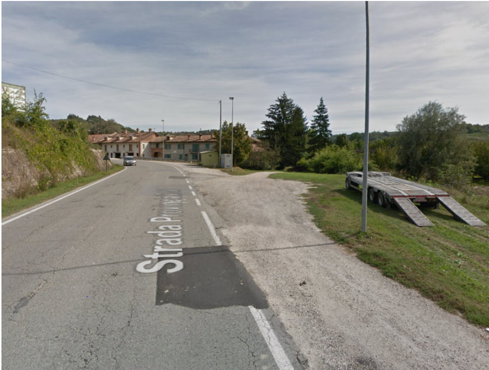
Figura 5 - direzione Castagnito. Possibile area stoccaggio materiale. Punto arrivo acquedotto Monferrato e cabina riduzione pressione metano

Comune di Vezza d'Alba, Località Bobore; spostamento adduttrice per Govone e rivisitazione sistema adduzione comuni di Govone, Castellinaldo, Castagnito Priocca e Magliano Alfieri.