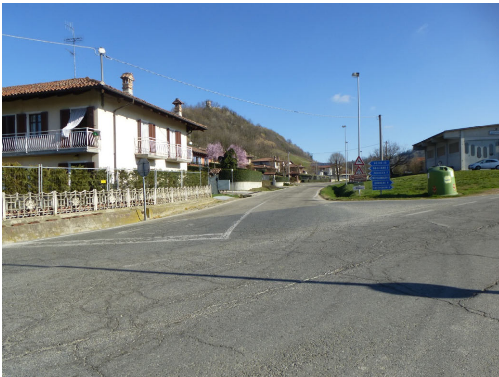
Figura 1 - Vista dalla SP50 dell'incrocio e di Via Castellinaldo (posizione pozzetto in progetto)