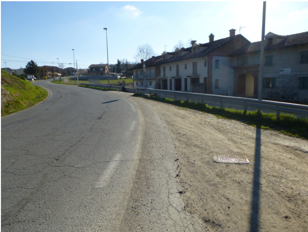
Figura 4 - direzione Castagnito posizione pozzetti ed interferenze