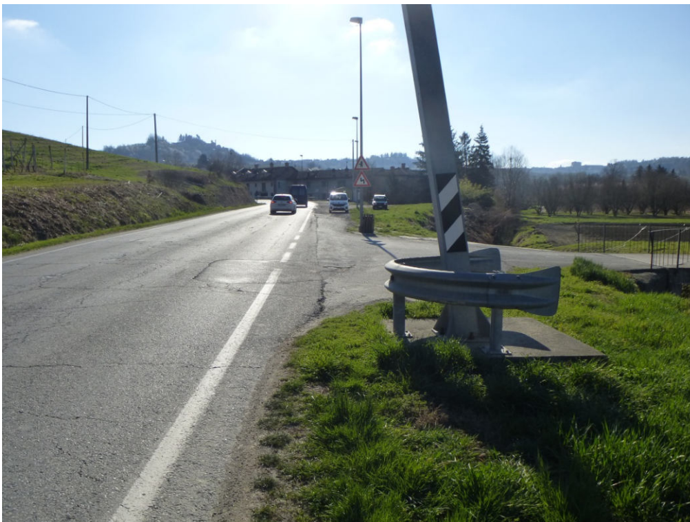
Figura 6 - direzione Castagnito vista dopo ponticello Rio Gavel. presenza illuminazione pubblica in banchina