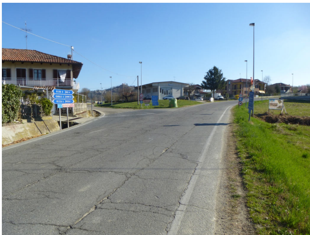
Figura 2 - incrocio SP 50 con Via Castellinaldo scatto da SP 50 direzione Castagnito