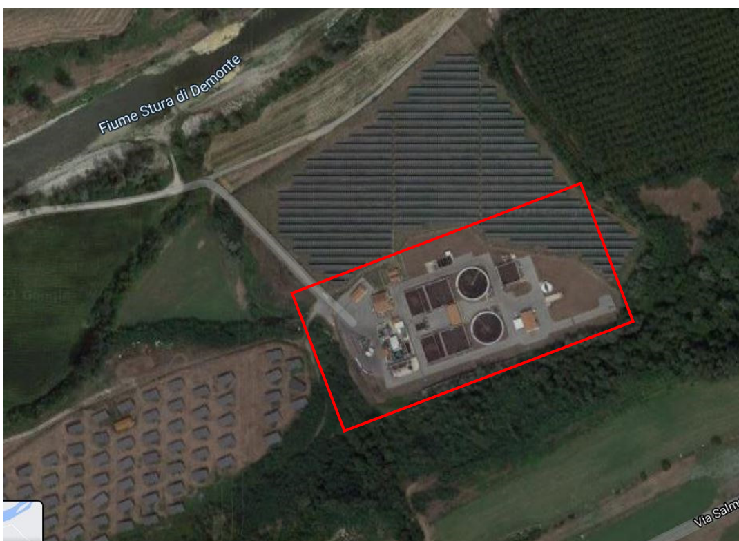
Figura 2 – Inquadramento dell'impianto di depurazione esistente nel comune di Fossano