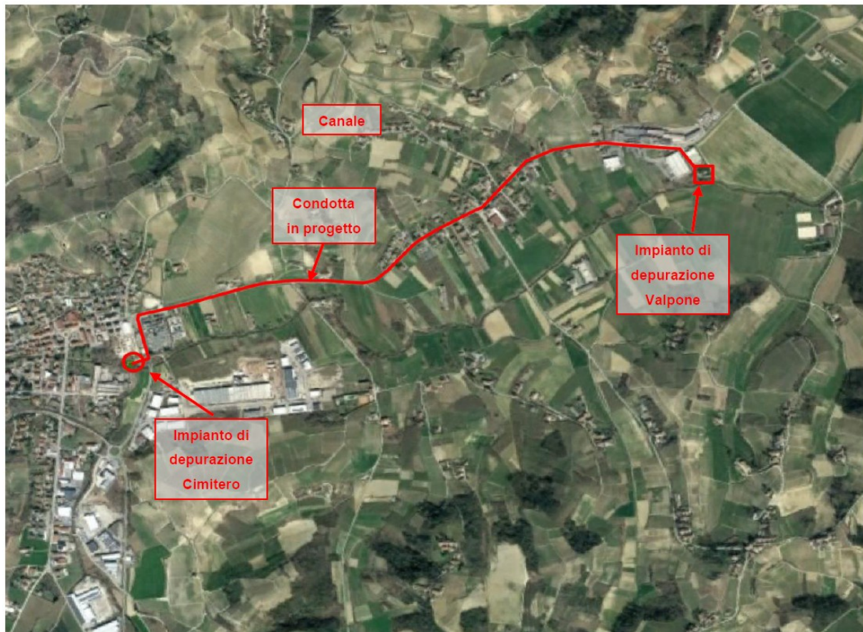
Figura 4 - Sistema di depurazione Comune di Canale

Le fognature esistenti afferenti ai depuratori di Canale (loc. Cimitero e Loc. Valpone) sono unitarie, per cui il dimensionamento dei sollevamenti, delle condotte fognarie e del potenziamento dell'impianto di Valpone, a livello idraulico, è stato effettuato considerando la portata media giornaliera in tempo secco (All. B al DPGR 17R del 16.12.2003)