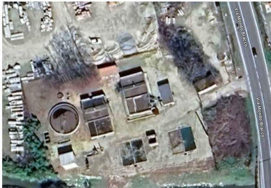
Figura 1 - Impianto di Canale- Loc. Cimitero

L'impianto di Canale in Loc. Cimitero possiede attualmente l'autorizzazione n. 4/2017 del 06.11.2017 per il trattamento di 5.000 AE e lo scarico nel corso d'acqua Torrente Bobore (Rio di Canale per lo scaricatore di piena) nel rispetto dei limiti previsti dalle tabelle 1 e 3 dell'Allegato 5 alla Parte Terza del D.Lgs 152/2006 e s.mm.ii..