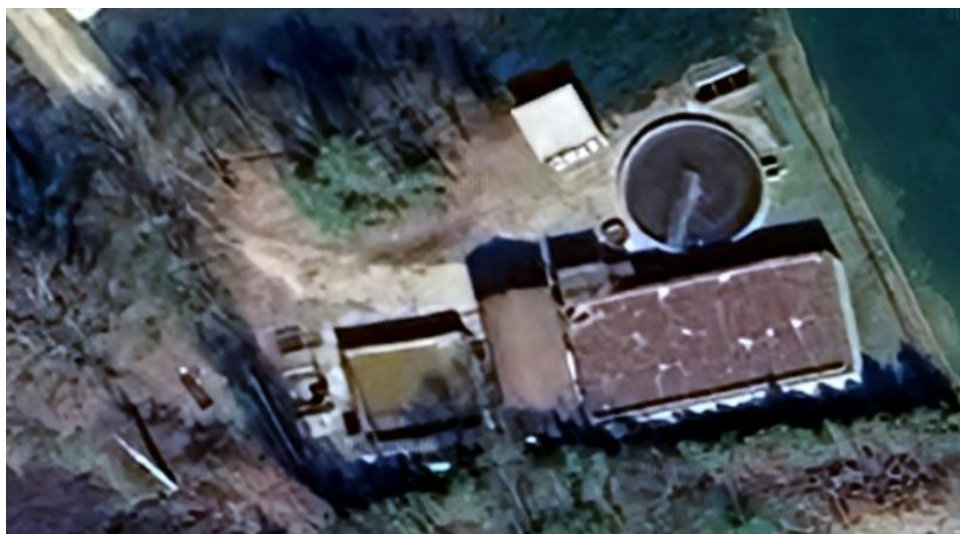
Figura 2 - Impianto di Canale- Loc. Valpone

L'impianto di Canale in Loc. Cimitero possiede attualmente l'autorizzazione n. 4/2017 del 06.11.2017 per il trattamento di 5.000 AE e lo scarico nel corso d'acqua Torrente Bobore (Rio di Canale per lo scaricatore di piena) nel rispetto dei limiti previsti dalle tabelle 1 e 3 dell'Allegato 5 alla Parte Terza del D.Lgs 152/2006 e s.mm.ii..