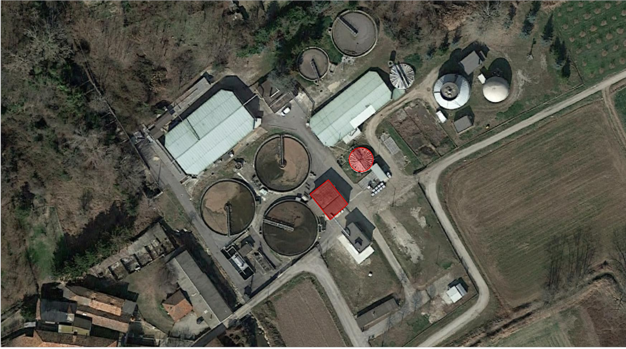
ESTRATTO ORTOFOTO IMPIANTO DEPURAZIONE LOC. LA BASSA , BRA SCALA 1:1000