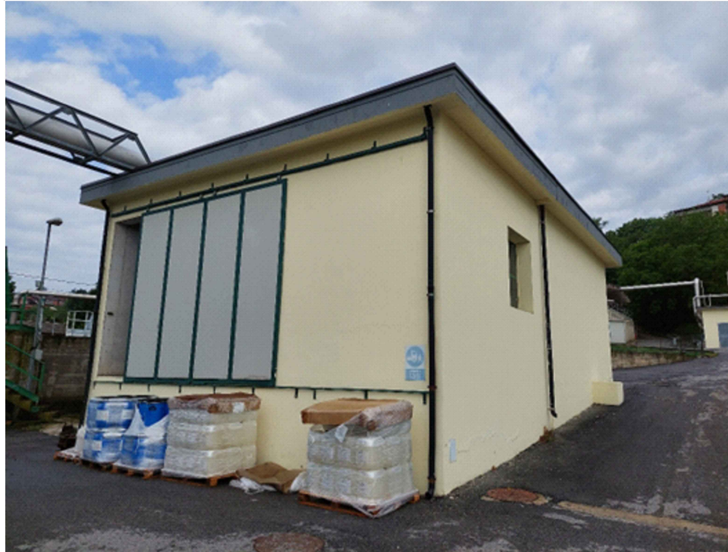
LOCALE DISIDRATAZIONE FANGHI ESISTENTE